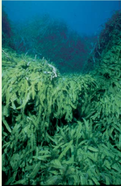
Infestación de Caulerpa

La Caulerpa fue introducida en el Mediterráneo sobre 1984, posiblemente con desechos procedentes del acuario de Mónaco. Se especula sobre si la especie liberada en el Mediterráneo era un clon más resistente del alga tropical original. Se adaptó bien a las aguas más frías y se expandió a través del Mediterráneo septentrional donde es una seria amenaza para la flora y fauna marina nativa. Es capaz de formar nuevas colonias a partir de pequeños fragmentos de la planta y, siendo un autostopista oportunista, es una amenaza para todo el Mediterráneo. Donde se ha establecido por sí misma, ha ahogado hábitat como las praderas marinas nativas donde crían numerosas especies. El 12 de Junio de 2000, en una laguna cerca de San Diego en los Estados Unidos, unos buceadores descubrieron un parche de Caulerpa que media unos 20x10 metros. También en este caso se pensó que la infestación debió ocurrir después de que alguien vaciase un acuario dentro de un desagüe. Afortunadamente esta invasión fue descubierta en un estadio temprano y se tomaron medidas para erradicarla.